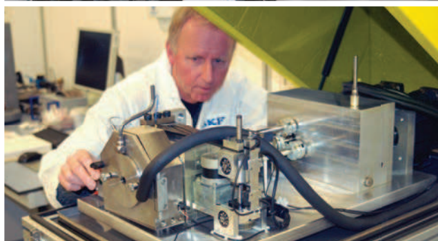
Научно-исследовательский центр SKF в Нидерландах